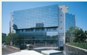
聖徳大学クリスタルホール外観

※JR常磐線、JR乗り入れ地下鉄千代田線、新京成線がご利用いただけます。 JR常磐線利用で上野駅から直通約20分、東京駅から24分です。