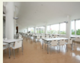
カフェ「リュミエール」