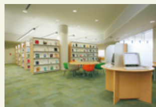
川並弘昭記念図書館閲覧室