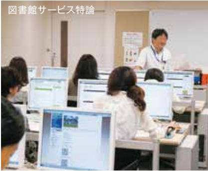
図書館サービス特論

1年で資格取得できる「学びやすさ」と、資格を取るだけでなく現場で役立つ「満足学習」。パートや業務委託として勤務する多くの図書館員の方々が、聖徳の通信を選ぶ理由がここにあります。